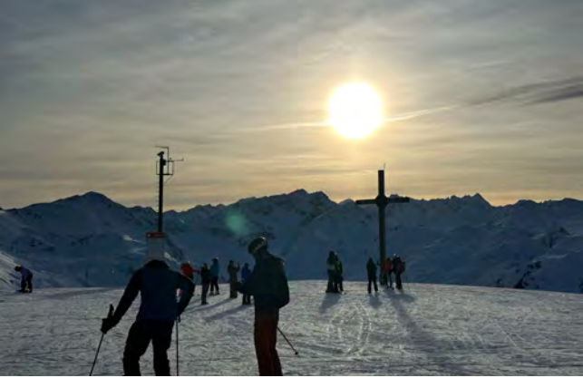
Abendlicher Ausblick am Gipfel der Axamer Lizum.