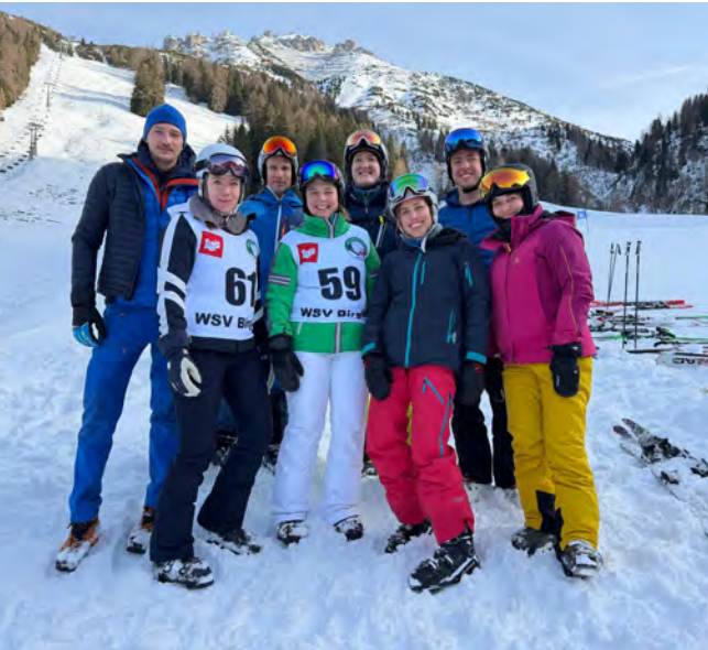
Die Landesgruppe Steiermark mit JI-Bundesvorsitzender Julia Aichhorn beim traditionellen Skirennen.

Die Tage in der Axamer Lizum haben einmal mehr gezeigt, wie wichtig solche Formate für die Junge Industrie sind: Sie schaffen Raum für Begegnung, stärken das Netzwerk und verbinden fachlichen Austausch mit gemeinsamen Erlebnissen. Die Vorfreude auf das nächste JI-Skiwochenende in der Steiermark ist damit bereits geweckt!