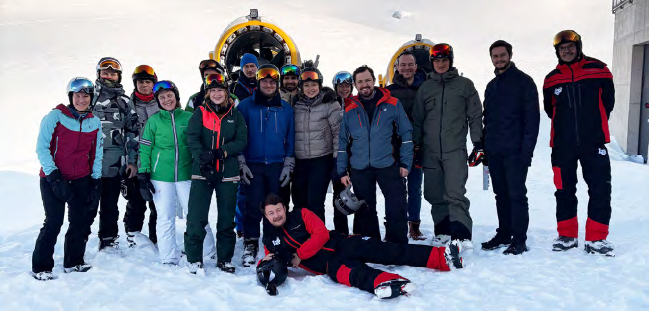
Einige Teilnehmerinnen und Teilnehmer aus ganz Österreich im Rahmen des JI-Skiwochenendes 2026.