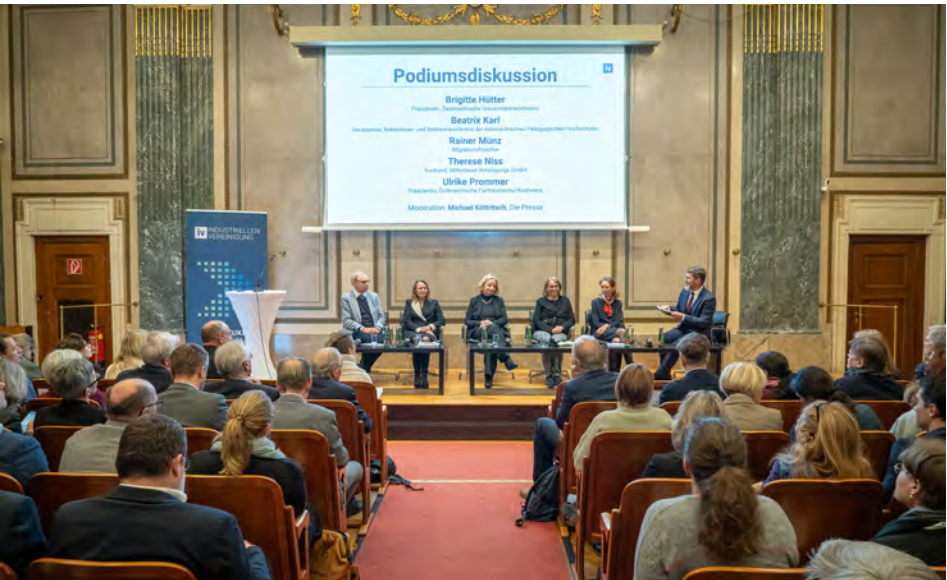
Die IV lud zu einer Diskussion der Hochschulstrategie.

mehr Effizienz, mehr Innovation und einen attraktiven Standort Österreich.